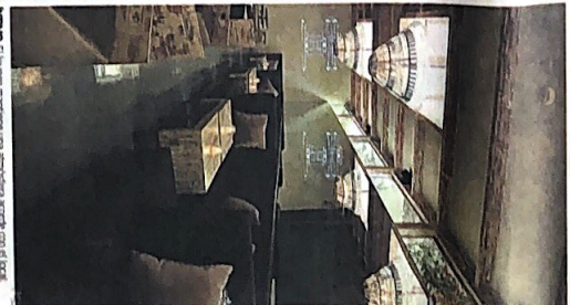
NOVAVAL. El lounge mantiene una arquitectura acorde con el local.

Los otros dos ambientes de Pica's, el restaurante y la barra, comparten con el lounge y la fachada un diseño común y vinculado con la tradición de la zona turística. Pica's es un espacio de proyecto que se caracteriza por su aspecto de tablores de madera que componen el bar. Así, el recibidor se convierte en la perspectiva del bar. Así, el recibidor se convierte en la perspectiva del bar. Así, el recibidor se convierte en la perspectiva del bar.