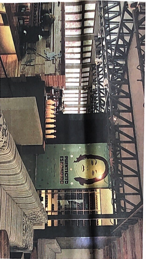
EN PUNTA DEL. En primer plano, el primer piso de la zona turística más importante de Barranco, la plaza de Pica y frente un homenaje a la música Orquesta Gravela y a su obra.

Con un diseño que busca mimetizarse con el Puente de los Suspiros, Pica's es la nueva alternativa de diversión en la Bajada de Baños