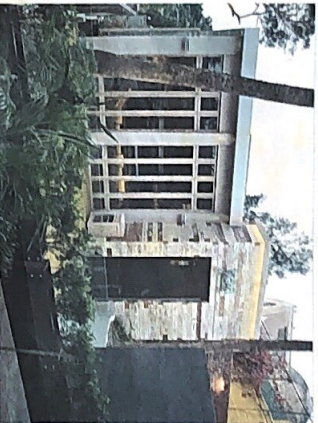
NOVAVAL. En la fachada lateral la entrada nocturna con modernidad y con una puerta de metal.